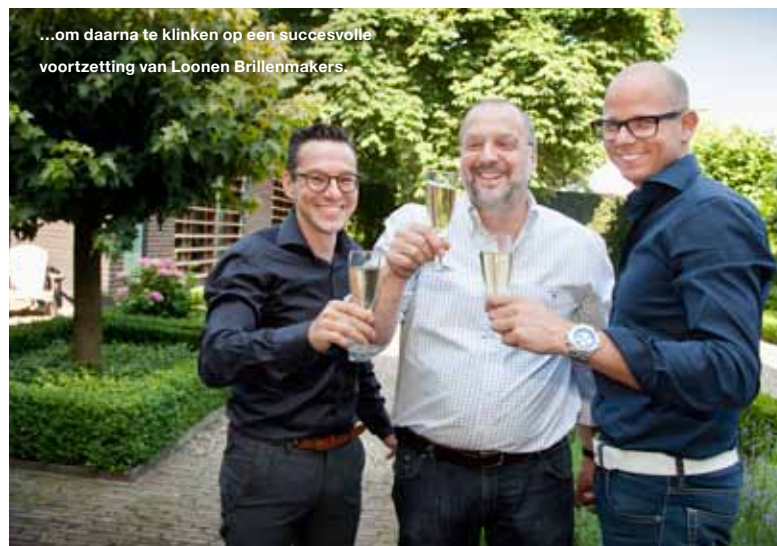
...om daarna te klinken op een succesvolle voortzetting van Loonen Brillenmakers.