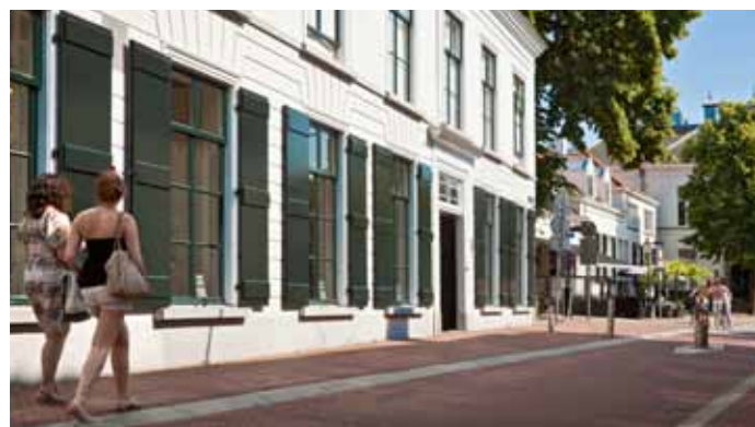
De Oude Pastorie: Loonen wilde het pand echt heel graag hebben, maar vanzelf ging het niet.